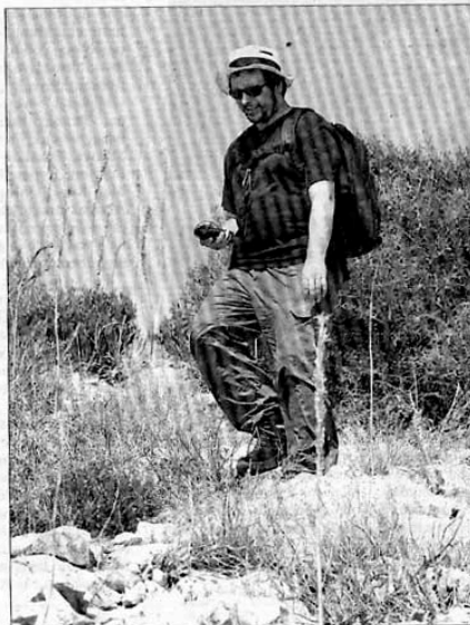
El artista alemán Thorsten Knaub, ayer durante un paseo.

Su intervención consiste en realizar paseos por la Isla que son registrados en un GPS y que luego son tratados con programas de animación sobre un mapa orográfico de la isla. «Cargo con el dispositivo y llevo la antena en la mochila», explicó Knaub, que tras haber presentado su proyecto GPSdiary hace unos meses, un archivo de sus propios movimientos