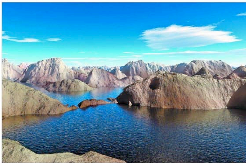
Fotografía de un paisaje artificial realizado por Joan Fontcuberta.