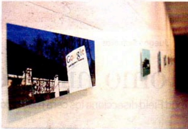
La exposición estará abierta hasta enero. MIGUEL ÁNGEL CAÑELLAS